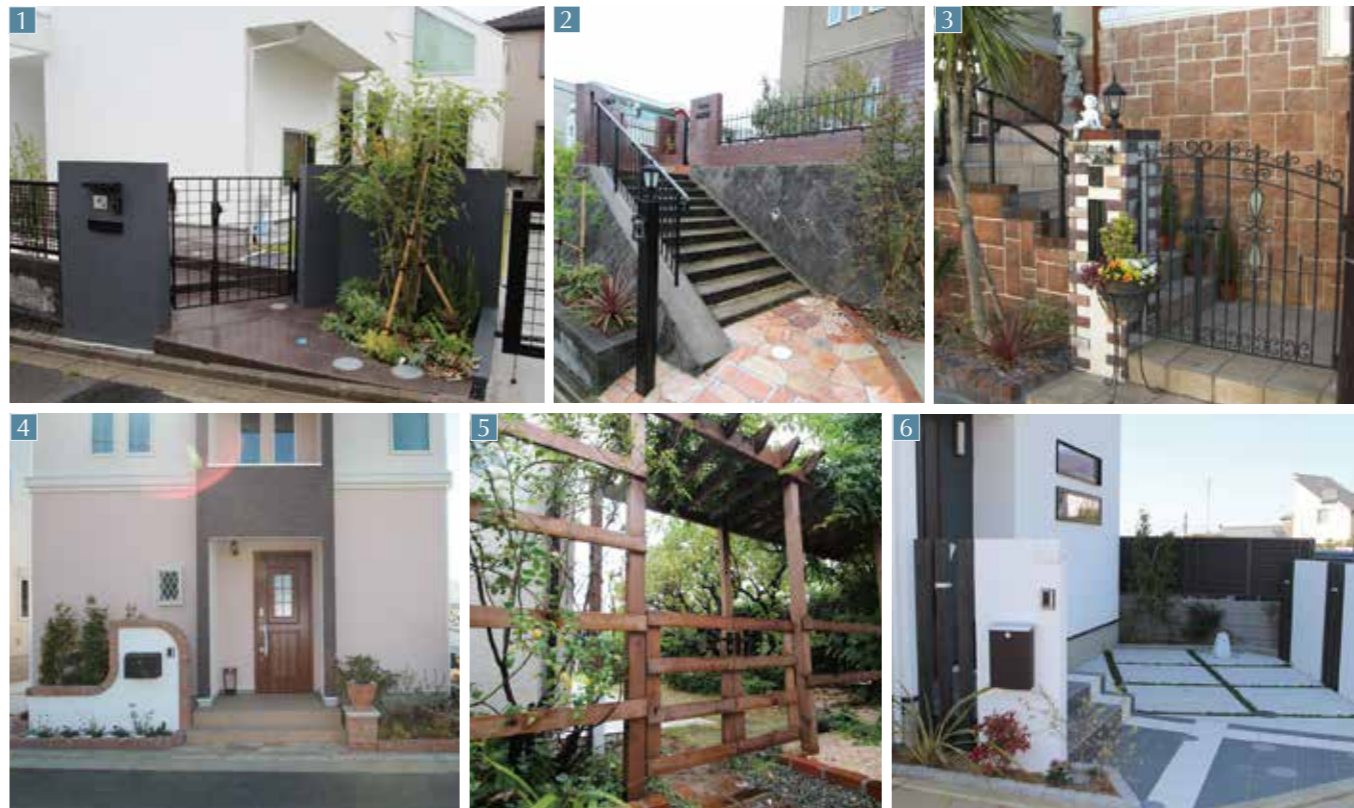
1 王禅寺西 K邸

誰もが憧れるサンルームとデッキ。駐車場の上に設置し限られた敷地を有効活用。広いアウトドアリビング+ルームが出来上がりました。