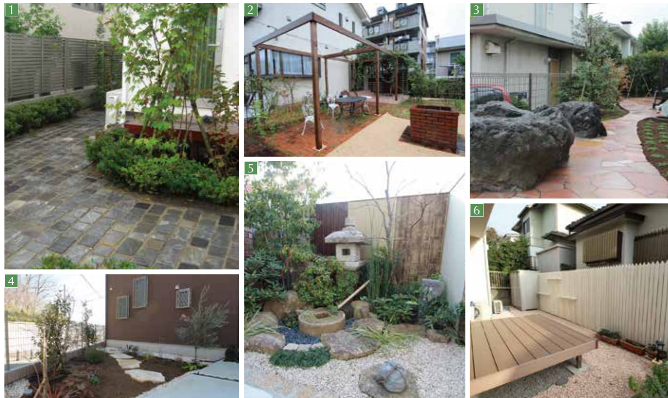
1 美しが丘西 Y邸

自然な雰囲気を作りたいという施主様の希望でした。雑木を中心に配植し、ヨーロッパから輸入した石畳はセメントを使わずに並べました。家屋との相性も良くまとまりました。