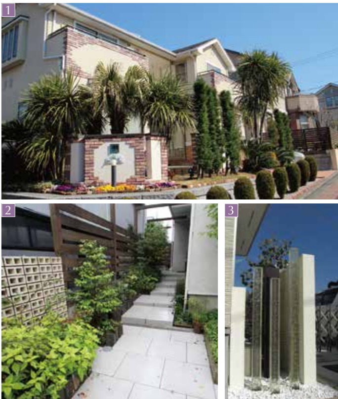
1 すずき野 M邸

正方形でデザインをまとめ、モノトーン色でシンプルモダンなオープン外構になりました。角柱に付いている照明も良いアクセントになります。